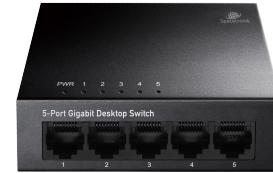
Installation Guide 5-Ports Gigabit Ethernet Switch Model: SP-SG105