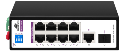
Installation Guide 10 Port 10/100/1000M Industrial PoE Switch Model: SP-SG108SP